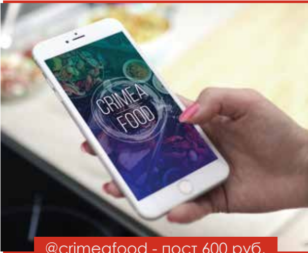
@crimeafood - пост 600 руб.