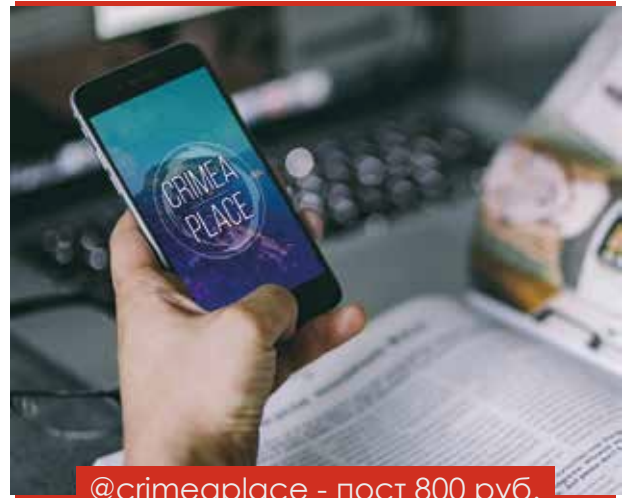
@crimeaplace - пост 800 руб.